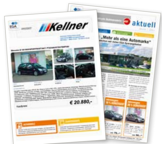
Auf Knopfdruck aus dem EGA-NET: Preisschilddruck und Prospekterstellung